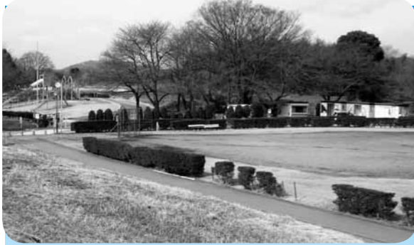
トイレ整備や遊具修繕等を行う木曾川扶桑緑地公園