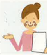
子育て世代包括支援センター