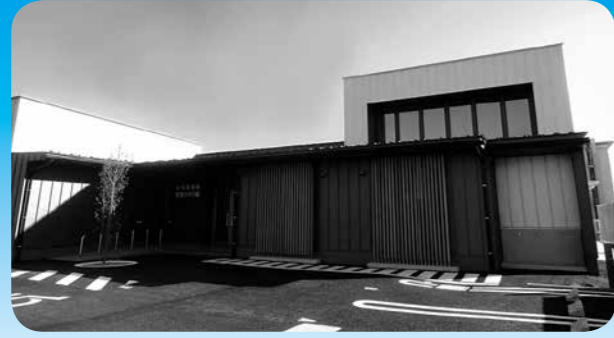
平成31年4月1日オープン山名放課後児童クラブ館 (対象年齢を6年生まで拡充して実施します。)