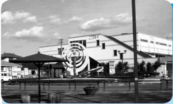
バリアフリー化が予定されている扶桑駅