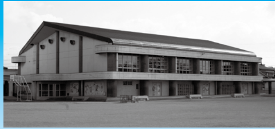
外壁改修、天井撤去等工事を行う柏森小学校体育館