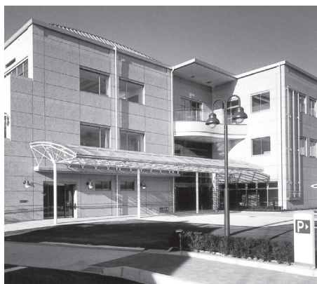
&lt; 扶桑町総合福祉センター 外観 &gt;