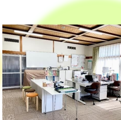
明るくゆったりとした空間