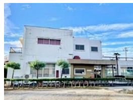
扶桑町いこいの家

ゆったりとおしゃべりするスペースや活動に使用できるお部屋もあります。ぜひご活用ください。