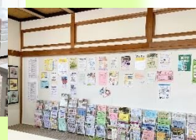
壁面全体が掲示板