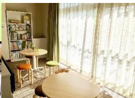
おしゃべりスペース