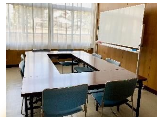
会議等の活動に利用できる ぶらんルーム(相談室)