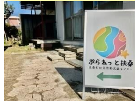
ぶらねっと扶桑の看板