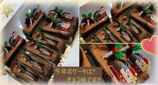
今年のケーキは? チョコ味です!!

今年度は各ホーム、準備も念入りに行い、思い思いの Christmas を過ごしました。