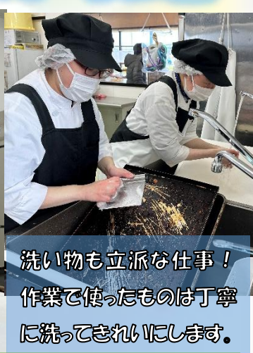
洗い物も立派な仕事！ 作業で使ったものは丁寧に 洗ってきれいになります。