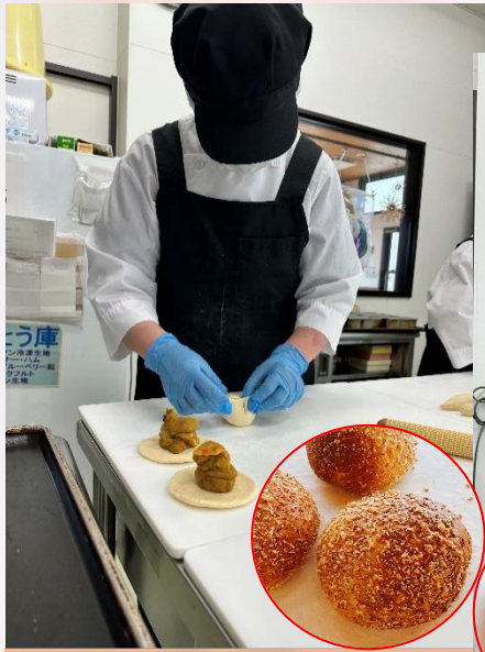
カレーパンの成型は高難度！ 中身がはみ出さないよう、慎重に 包んでいきます。