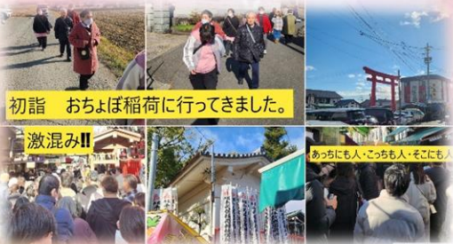
初詣 おちよぼ稲荷に行ってきました。