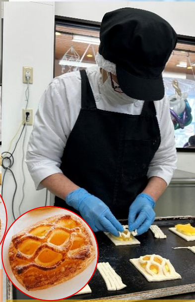
アップルパイの網をかけてます！ ちぎれないようにそーっと。