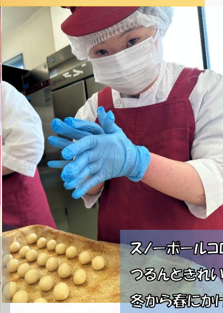
スノーボールコロコロ丸め隊！ つるんときれいなまん丸になるように丸めます。 冬から春にかけての限定商品ですよ！