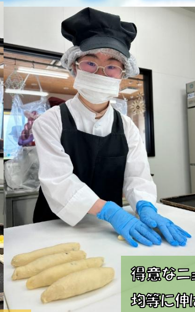
得意なニョロちゃんパンを成型中！ 均等に伸ばすのは難しい〜