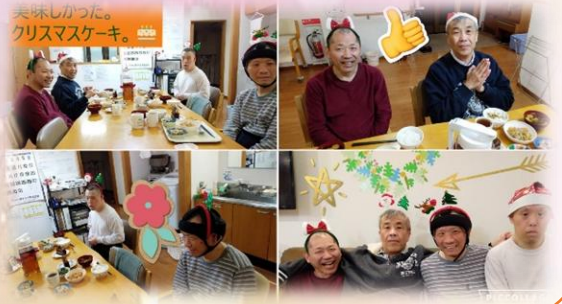
美味しかった。 クリスマスケーキ。

2025年元旦は、インフルの猛威で初詣中止 今回リベンジとなりましたが、目標達成!!