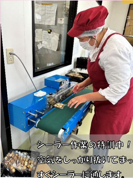
シーラー作業の特訓中！ 空気をしっかり抜いてまっ すぐシーラーに通します。