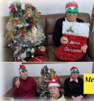
Merry Christmas 2025.12月