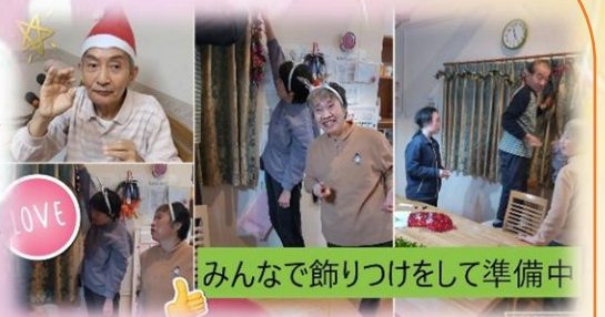
みんなで飾りつけをして準備中