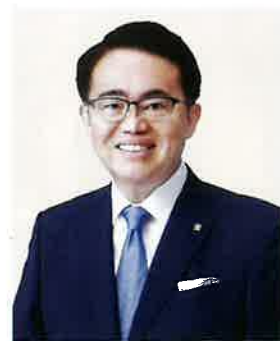
日本赤十字社愛知県支部 支部長

本年も地域に寄り添い、必要とされる支援を着実に実施してまいります。今後とも引き続きご理解とご支援を賜りますようお願い申し上げます。