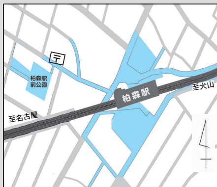
柏森駅周辺自転車等放置禁止区域