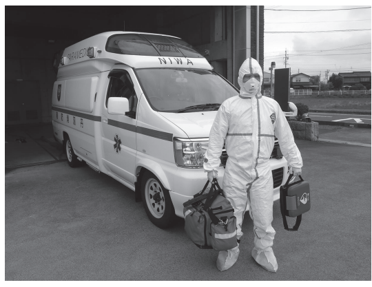
感染防護服装着後