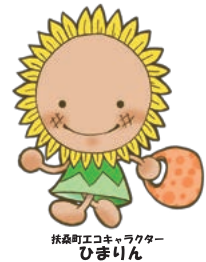
扶桑町エコキャラクター ひまわりん

扶桑町スポーツ推進委員会 扶桑町体育協会 NPO法人わっと楽しくスポーツふうそう スポーツ協力員 扶桑町子ども会連絡協議会 扶桑町女性の会連絡協議会 扶桑町赤十字奉仕団 日本ボーイスカウト犬山第七団 地域ボランティア 扶桑中・扶桑北中学生ボランティア 役場職員ボランティア (順不同)