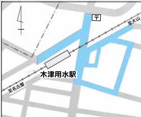
木津用水駅周辺自転車等放置禁止区域