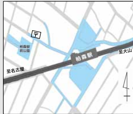
柏森駅周辺自転車等放置禁止区域