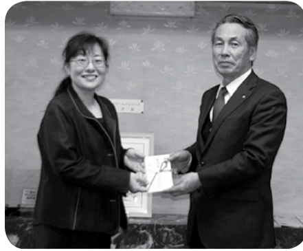
一、金十六万一千百五円 漬処壽俵屋扶桑總本家 様