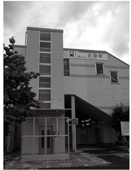
名鉄扶桑駅のエレベーター

私たち一人一人が、住み慣れた地域で個人として尊重され、自らの意思によって自由に行動でき、あらゆる分野の活動に参加する機会が確保される地域社会を目指すものです。そのためには、あらゆる施設を円滑に利用できるようにすることが大切です。