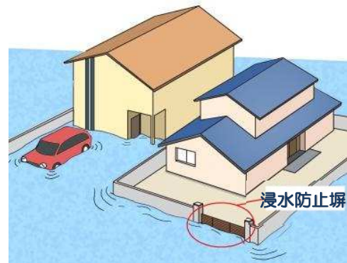
※浸水防止塀の設置イメージ図

豪雨による浸水から家屋等を守るため、新たに浸水防止塀を設置する場合に補助します。