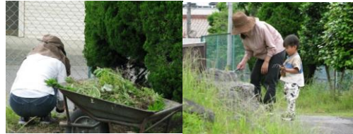
6月1日(月) 絶好の草取りデーとなりました。