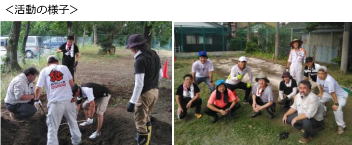
校内に枯葉の処分穴と耕作地の造成 令和5年7月

<活動の概要> ・会員の募集は随時行っています。 ・定期テストに合わせた挨拶運動以外の活動は不定期の為、LINEでの連絡となります。