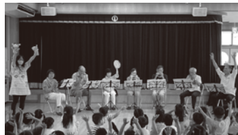
7月18日 柏森南保育園

扶桑世代間交流会の企画・運営により、主に柏森・柏森南保育園で、紙芝居と扶桑ハーモニカクラブの演奏交流会をしています。