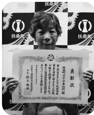
愛知県社会福祉協議会 会長表彰 扶桑町赤十字奉仕団

日本赤十字社愛知県支部扶桑町分区へ上記の金額が寄せられました。ご協力ありがとうございました。