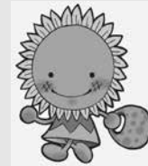
▲エコキャラクター「ひまりん」