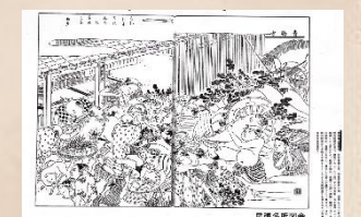
(枇杷島の青物市場)

写真は、「尾張名所図会」が描く「枇杷島の青物市」の様子です。枇杷島橋の西あたりで、柳街道の起点となった場所です。38軒の青物市問屋が並ぶ問屋町です。尾張を始め、美濃・三河・伊勢・駿河・京・大阪の産物が、毎朝山をなし買い出しの商人でごった返したそうです。現在、この地に絵図の右側に見える大根をかついだハチマキ男の像が建っています。(西春日井郡西枇杷島町)