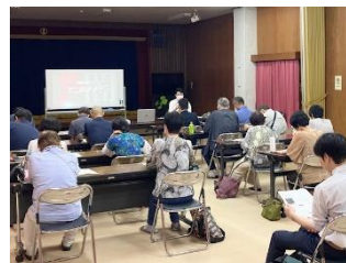
幅広い世代の方々が集まりました

クラウドファンディングにおいて実績のある二人の講師が、成功例(光)や苦労された例(闇)をお話してくださいました。初心者向け、男性向けなど、対象ごとのおすすめのサイトの紹介や、準備段階の解決策(5W3Hが大事など)のレクチャーなど、具体的なお話を聴く事ができました。参加者からは「継続して獲得してくにはどうしたら?」など多くの質問があり、その都度わかりやすく教えていただきました。