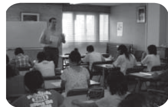
事前研修の 英会話セッション

今年もたくさんの応募の中から選ばれた18名の小中学生が約1週間のオーストラリアでの生活を体験しました。