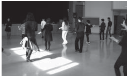
ラテンダンス（サルサ・フォルクローレ）講座

より多くの方にいろいろな国の文化を知ってもらうことを目的に中国語講座やラテンダンス体験講座などを開催しました。また、ふそう町民まつりでは中国や韓国・ペルー料理の試食コーナーとペルーの民族舞踊ステージを行いました。