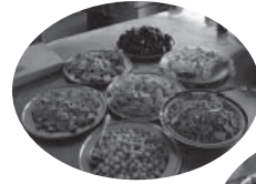
インドのおやつ とブラジル料理