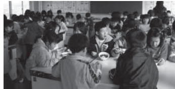
料理とお菓子を試食