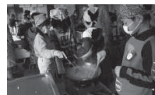
インド料理を作ろう