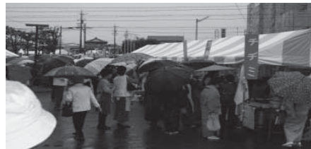
多くの人でにぎわった試食コーナー