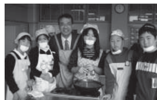
インド料理を作ろう