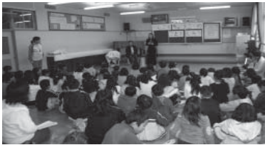
中国・韓国について知ろう