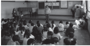
ブラジル・インドについて知ろう