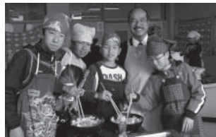
韓国料理を作ろう