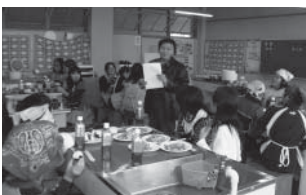
韓国料理を作ろう