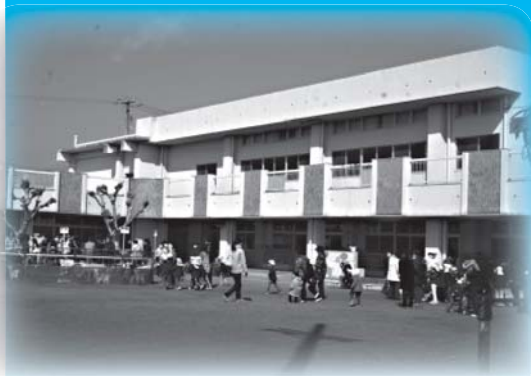
▲耐震等改修工事を予定している山名保育園