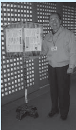
▲文化会館に設置された足つき型の高札

高札は、足つき型と壁掛け型の2種類。いずれも杉板できており、表面を焼き付け加工を施した風合いのある仕上がりです。歌舞伎をはじめとする、日本の伝統芸能公演をおこなう扶桑文化会館の雰囲気にもふさわしい、すばらしい出来映えです。ぜひ、お近くの設置場所をご覧ください。