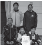
レッドの部(1) 優勝 モンスターズB