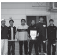
イエローの部(3) 優勝 チーム羽根