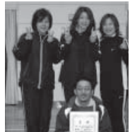
ブルーの部(1) 優勝 ZOOブルー