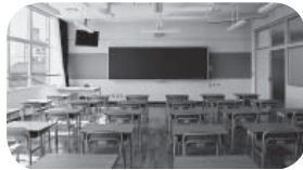
増築された校舎 (左) と教室 (右)