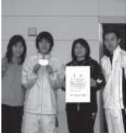
ブラックの部優勝 アクアボール(スパックス)