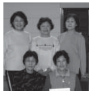
イエローの部(4) 優勝 さくら

〈ホームページ(HP) 閲覧手順〉 (扶桑町HPトップページ) ↓ (サイトマップ) ↓ (ソフトバレーボール大会)