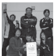
ブルーの部(1) 優勝 ズームウォール2