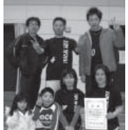
レッドの部(2) 優勝 ズームウォール1