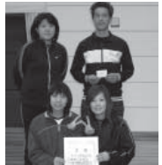
ブルーの部(2) 優勝 スマイリー