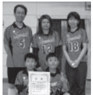
イエローの部(2) 優勝 スーパーコンビC