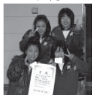
ホワイトの部優勝 MA2N