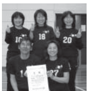
イエローの部(1) 優勝 オニクスブラック